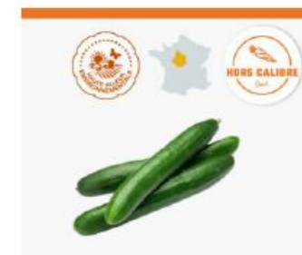
Détails page produit