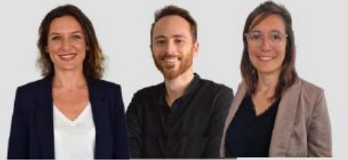
Directrice commerciale Manager des ventes Responsable Comptes clés