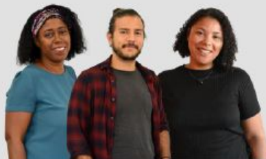
3 assistants commerciaux