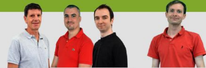
Responsable Logistique Responsable Logistique Assistant Logistique Administrateur des systèmes d'information