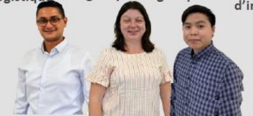
Responsable Comptabilité Générale 2 Assistants Comptabilité Gestion

DES SERVICES SUPPORTS SPÉCIALISTES ET INVESTIS