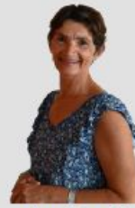
Assistante Marchés Publics