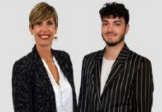
Responsable Marketing Communication Assistant Marketing Communication