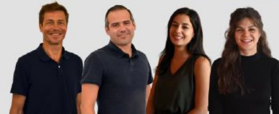
Responsable Achat Responsable Appro Qualité Assistante Appro Qualité Stagiaire Assistante Achats