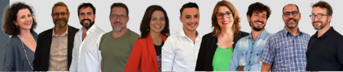
10 commerciaux répartis sur la France entière

UN BINÔME COMMERCIAL DÉDIÉ A CHAQUE CLIENT