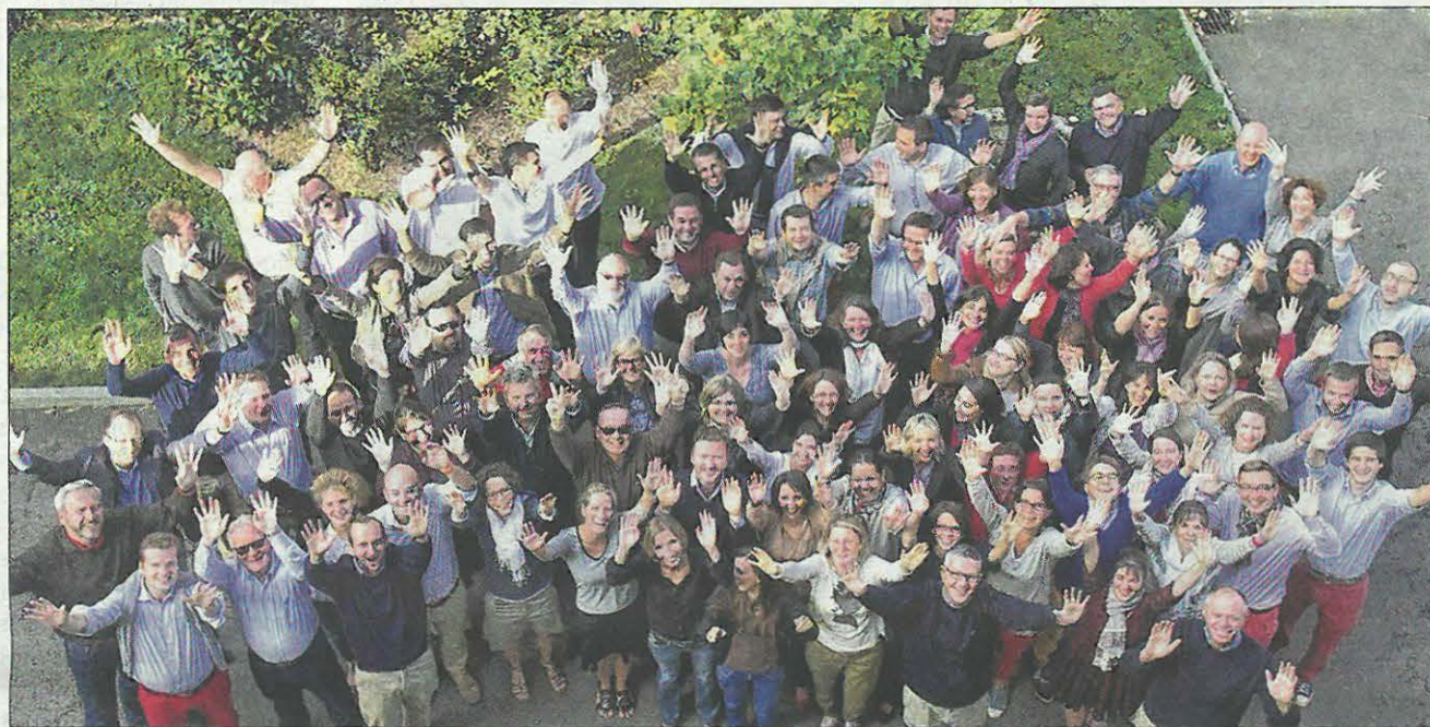
Travailler au Cèdre s'est aussi adhérer à la philosophie de l'entreprise.

Le Cèdre est une société singulière qui propose ses services à des associations, entreprises et congrégations chrétiennes.